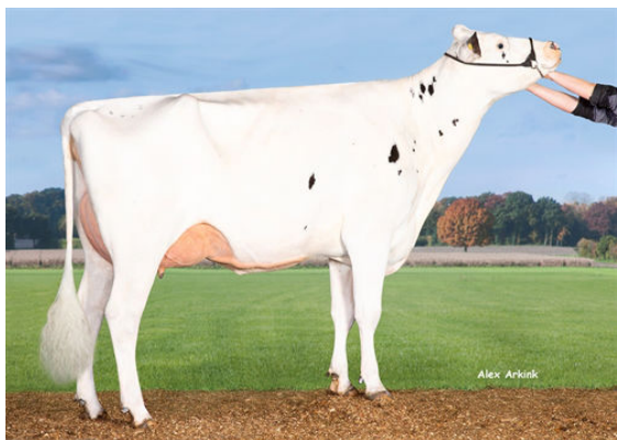
K&L OH ROZELLA GRANDDAM