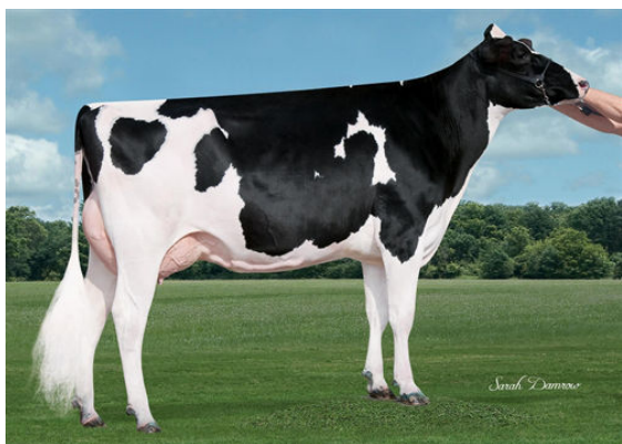
SIEMERS DOORMAN ROZ FOURTH DAM